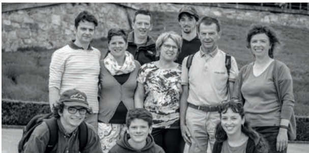
Reizen is altijd leuk

Daarom vraag ik U voor de N-VA te stemmen.