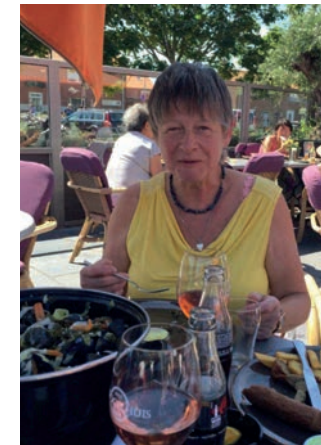
Vlaming en Bourgondiër

bij de verdere opbouw van een Laarne-Kalken waar het aangenaam en duurzaam leven, wonen en werken is.