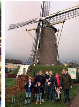
Op stap met familie