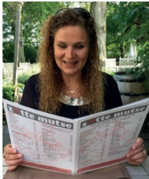
Een toepasselijk restaurant