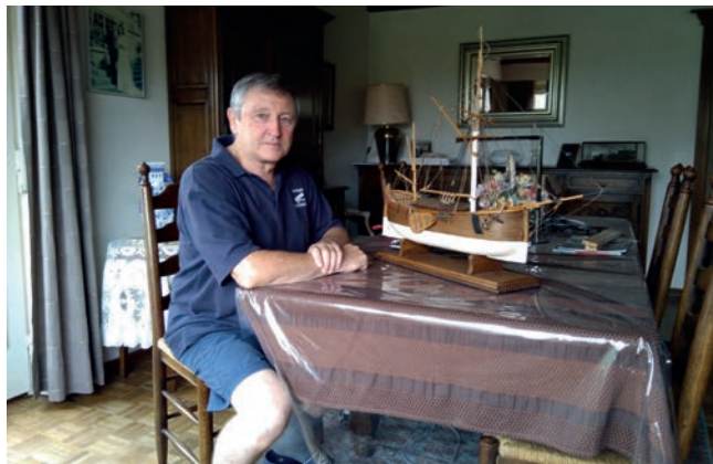
Modelbouw, hobby of passie?

Ik heb mij steeds Vlaming gevoeld, en zie in de N-VA de partij die opkomt voor de juiste zaak. Ik ben dan ook bereid mij hiervoor in te zetten.